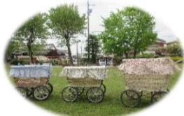
乳母車のカバーが新しくなりました。